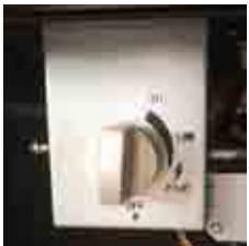
comando / control