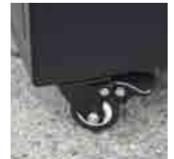
blocco ruota / wheel lock