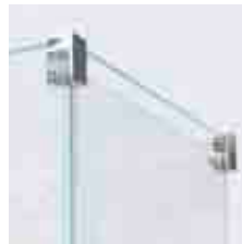
cristallo / crystal