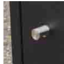
pomello / knob